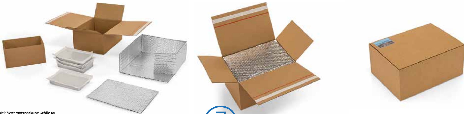
Beispiel: Systemverpackung Gre M

Ist nicht die richtige Gre dabei? Kein Problem, wir knnen Ihnen auch Ihre individuelle Systembox mit Ihren Anforderungen konstruieren. Sprechen Sie uns an!